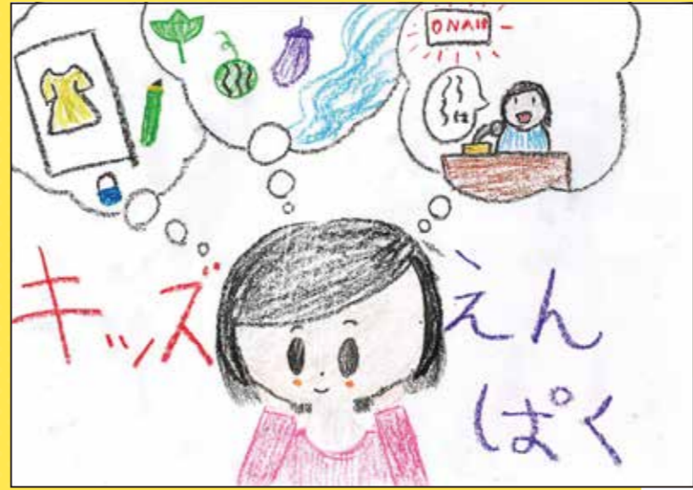
▲2023お絵かきコンテスト最優秀賞