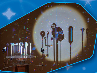
《アスタリス》 岡田憲一+冷水久仁江 (LENS) © kenichi OKADA+kunie HIYAMIZU (LENS)