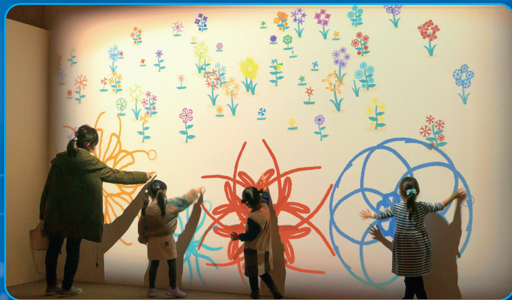
《ユビサキに咲く》Ponboks(本多大和) © Ponboks (yamato HONDA)