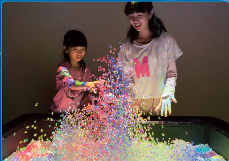
《SplashDisplay》の場やすし / 山野真吾 / 徳井太郎 © yasushi MATOBA / shingo YAMANO / taro TOKUI