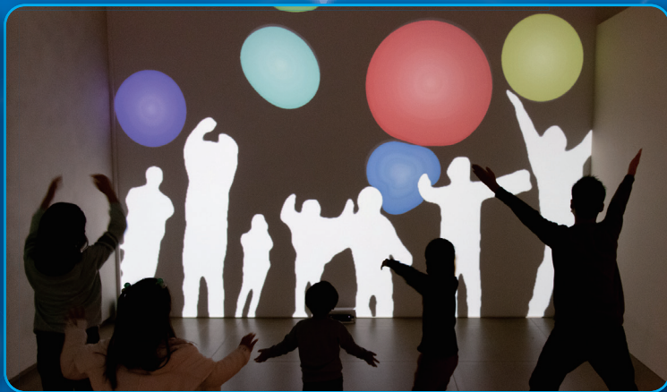
《Immersive Shadow: Bubbles》藤本直明 © naoaki FUJIMOTO