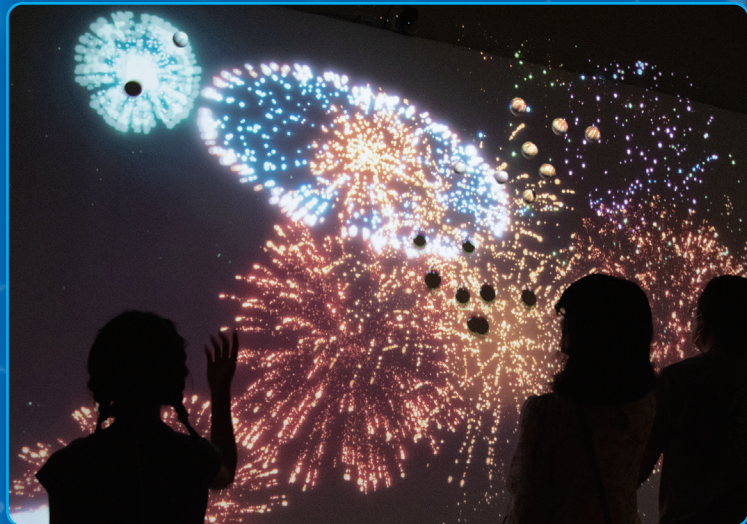
《なげる、あてる、ひろがる》スイッチ © Switch 協力:名古屋造形大学 情報表現領域