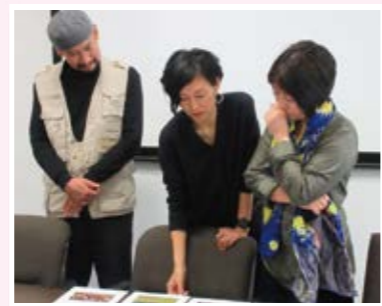
◀ 応募作品の審査の様子(写真部門)