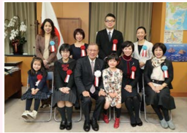
▲ 宮腰少子化担当大臣による表彰後の記念撮影