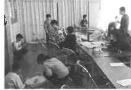
厚生労働大臣賞受賞 特定非営利活動法人 とりで 山口県岩国市

すべての子どもたちが 自己実現できる社会を目指して 福岡県で発達に遅れや特性のある子ども たちをキャリア面から支援する活動 です。企業と連携したお仕事体験を はじめとして、障がい者を取り巻く環境 について啓発するイベントなどを開催 しています。「障がい」を理解しともに 歩むことが、豊かな社会づくりに通じると いう認知の拡大のために活動しています。