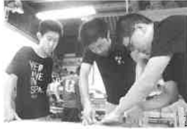
文部科学大臣賞受賞 一般社団法人 チャレキッズ 福岡県福岡市

すべての子どもたちが 自己実現できる社会を目指して 福岡県で発達に遅れや特性のある子ども たちをキャリア面から支援する活動 です。企業と連携したお仕事体験を はじめとして、障がい者を取り巻く環境 について啓発するイベントなどを開催 しています。「障がい」を理解しともに 歩むことが、豊かな社会づくりに通じると いう認知の拡大のために活動しています。